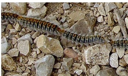
Chenilles processionnaires en transit

C'est une variété de chenille facile à identifier car elle se déplace à la suite les unes des autres ce qui leur a valu leur nom.