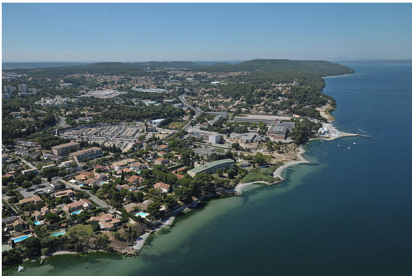
Les rives nord de l'étang (vue aérienne)

Secteurs résidentiels, habitats pavillonnaires, collectifs, privés ou à caractère social, se côtoient harmonieusement. La zone d'activités de Figuerolles, espace de loisirs et d'activités commerciales, renforce son attractivité.