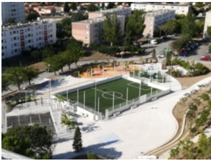
Mas de Pouane : la place centrale (vue aérienne)

La place centrale a été inauguré le vendredi 13 septembre 2019 elle est situé au coeur du quartier elle est doté de nombreux équipements :