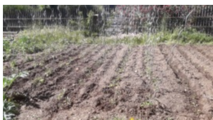
Jardin partagé Mas de Pouane (mai 2020)