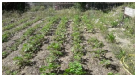
Jardin partagé Mas de Pouane (mai 2020)