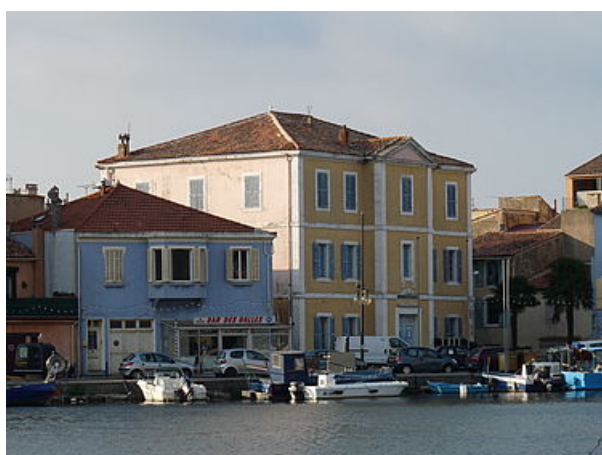
La prud'homie de pêche de Martigues aujourd'hui, quai Lucien Toulmond