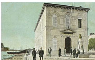
La Prud'homie de pêche, carte postale, fonds des archives communales de Martigues (4Fi4-27)

À sa fondation, elle est sise sur le plan de Meyran dans un local où la corporation du grand art se réunissait déjà. Le tribunal siège dans une petite bâtisse d'un étage, dépendance d'une chapelle de Pénitents noirs (1654) désaffectée en 1758 puis transformée en une halle aux poissons, un refuge pour les chemineaux et une scène de théâtre populaire.