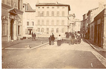
Devant l'ancienne prud'homie avant 1899