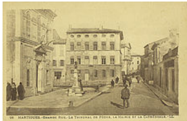
La Prud'homie de pêche, carte postale, fonds des archives communales de Martigues (4Fi4-39)

Le 1er août 1858, un bâtiment est spécifiquement inauguré pour la prud'homie martégale, tout près de l'ancienne bâtisse de l'autre côté de la route départementale, au débouché du pont du Roi sur le plan de Meyran. Il se situe devant la façade sud de l'ancienne mairie, l'hôtel Colla de Pradines, à l'emplacement actuel de la terminaison ouest du quai des Anglais. Le rez-de-chaussée accueille la halle aux poissons. Le tribunal se trouve au 1er étage. La façade est en bordure de chaussée. Édifice sobre et imposant, ordonnancement de fenêtres en arcs plein cintre, la façade sud possède une corniche à modillons sous la toiture. L'entrée est marquée par un tympan soutenu par deux pilastres à chapiteaux corinthiens ; l'inscription « Tribunal de pêche » est en lettres dorées.