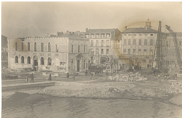
Démolition de l'ancienne prud'homie, 12 décembre 1923, fonds des archives communales de Martigues – Travaux de la traversée de Martigues – Photo n° 52

La prud'homie actuelle se situe au 12, quai Lucien Toulmond sur une parcelle de 695 m 2 . L'immeuble comprend deux étages. La porte d'entrée comporte un relief où figure les outils et des produits de la pêche associés aux armes de saint Pierre, patron des pêcheurs. L'immeuble a été vendu à la communauté des patrons-pêcheurs en 1920 par Michel Coste, négociant. L'inauguration se déroule le 3 juillet 1921. Entre 1859 et jusque vers 1910, le bâtiment avait été le siège d'un couvent de la congrégation des sœurs du Saint-Nom-de-Jésus-et-de-Marie.