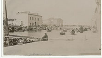
Joutes dans le canal du Roi, fête de la Saint-Pierre devant l'ancienne prud'homie, fonds des archives communales de Martigues (3 Fi)