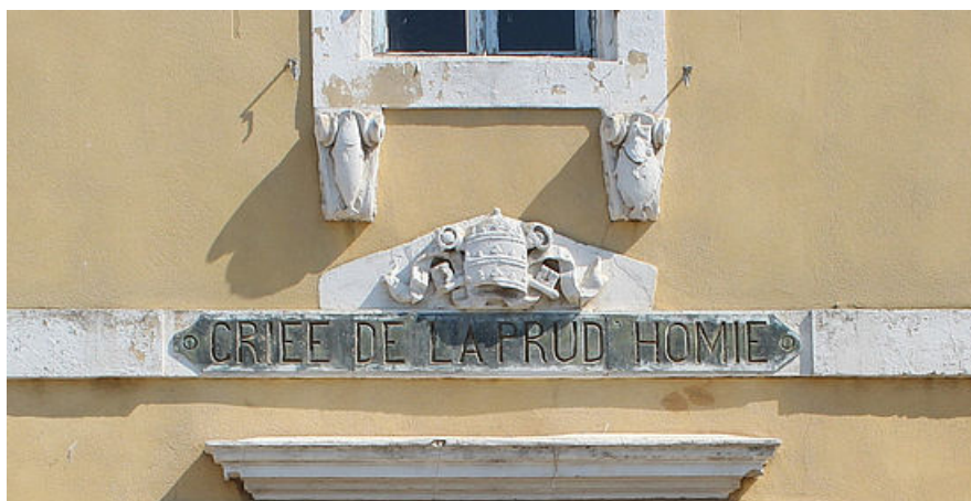
Fronton avant de l'entrée du bâtiment du tribunal de pêche de Martigues, quai Lucien Toulmond, service Ville d'art et d'histoire, août 2019

La prud'homie actuelle se situe au 12, quai Lucien Toulmond sur une parcelle de 695 m 2 . L'immeuble comprend deux étages. La porte d'entrée comporte un relief où figure les outils et des produits de la pêche associés aux armes de saint Pierre, patron des pêcheurs. L'immeuble a été vendu à la communauté des patrons-pêcheurs en 1920 par Michel Coste, négociant. L'inauguration se déroule le 3 juillet 1921. Entre 1859 et jusque vers 1910, le bâtiment avait été le siège d'un couvent de la congrégation des sœurs du Saint-Nom-de-Jésus-et-de-Marie.