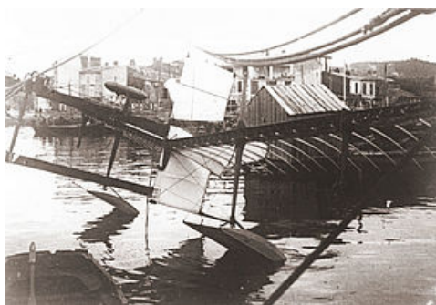
centenaire du 1er vol en hydravion par Henri Fabre