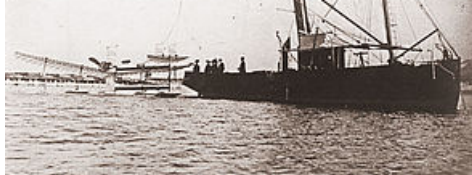
centenaire du 1er vol en hydravion par Henri Fabre