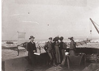
centenaire du 1er vol en hydravion par Henri Fabre