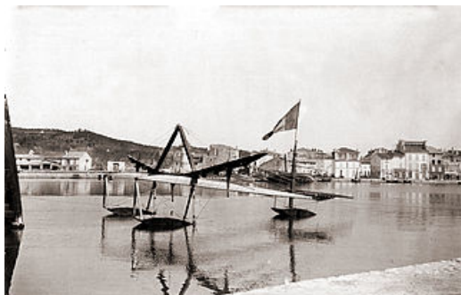
centenaire du 1er vol en hydravion par Henri Fabre