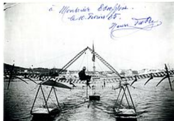
centenaire du 1er vol en hydravion par Henri Fabre - Photo © Famille Fabre