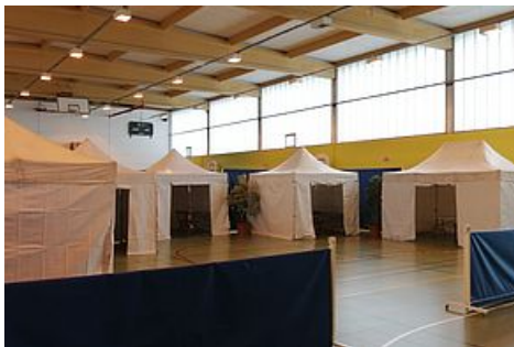
Installation du centre de consultation Covid19 dans le gymnase Pagnol