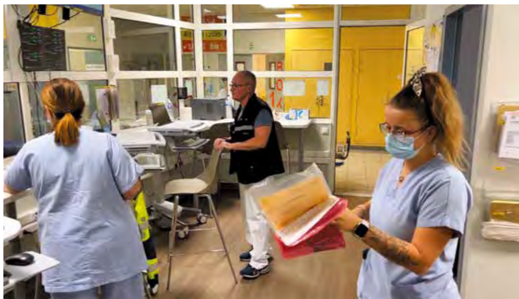
Le service des urgences de l'hôpital des Rayettes a accueilli jusqu'à 200 patients par jour pour une capacité de 110.

L'épidémie de grippe a entraîné le déclenchement du plan blanc de l'Hôpital des Rayettes. Solidaire, la Maison de santé de l'Escaillon revoit ses horaires