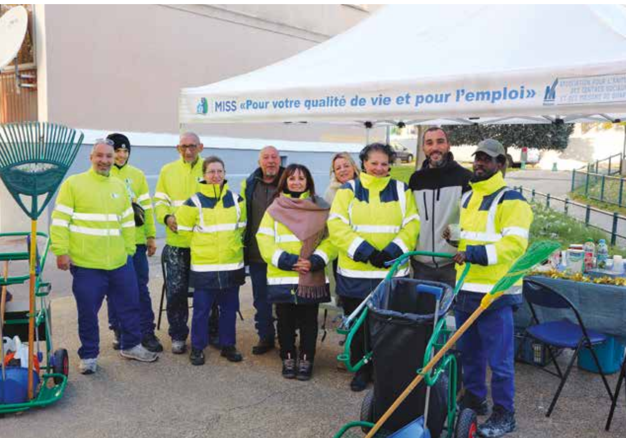
Café des voisins, entretien des bâtiments, propreté, l'équipe de MISS à Mas de Pouane est parée pour la journée.

Martigues Insertion Solidarité Services fête en ce début d'année son cinquième anniversaire. Le dispositif, créé pour venir en aide aux habitantes et habitants éloignés de l'emploi, arrive à maturité avec quatre conciergeries et une cinquantaine de salariés en insertion