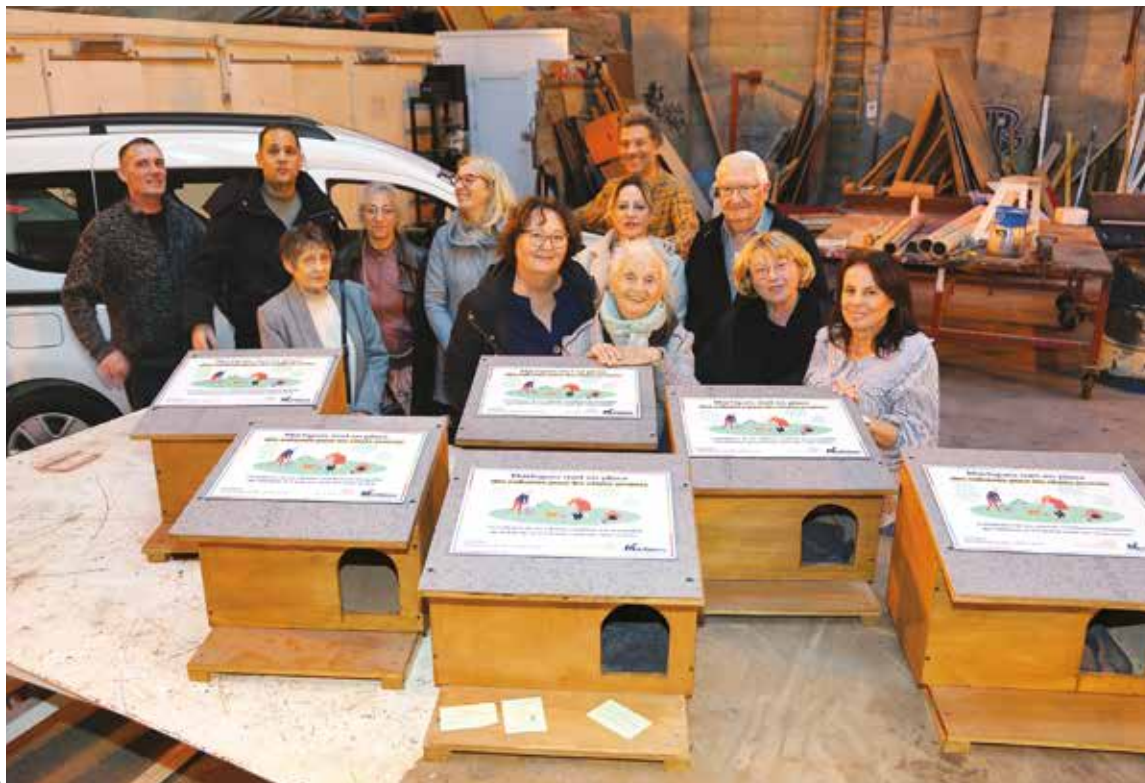
Les bénévoles de « L'École du chat libre » étaient réjouis de voir ces nouvelles cabanes en bois fabriquées avec l'aide de la Ville.

De nouvelles cabanes à chats ont été installées dans plusieurs quartiers de Martigues. Ce projet marque une étape importante dans la gestion des félins sur le territoire par la Ville et l'association « L'École du chat libre »