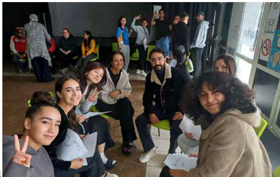
Pendant l'atelier linguistique, les participants de l'échange apprennent des mots en arabe, en allemand et en français.

Ils n'ont pas dit un mot, et pourtant, le message est clair. Dans un court-métrage posté sur la chaîne Youtube « Au cœur de l'AACS », douze jeunes Martégaux ont joué les acteurs pour sensibiliser aux problématiques de la fast fashion. Surconsommation, pollution, inégalités, avec des tas de vêtements empilés sur le sol, ils ont dénoncé l'impact écologique et social de ce mode de consommation.