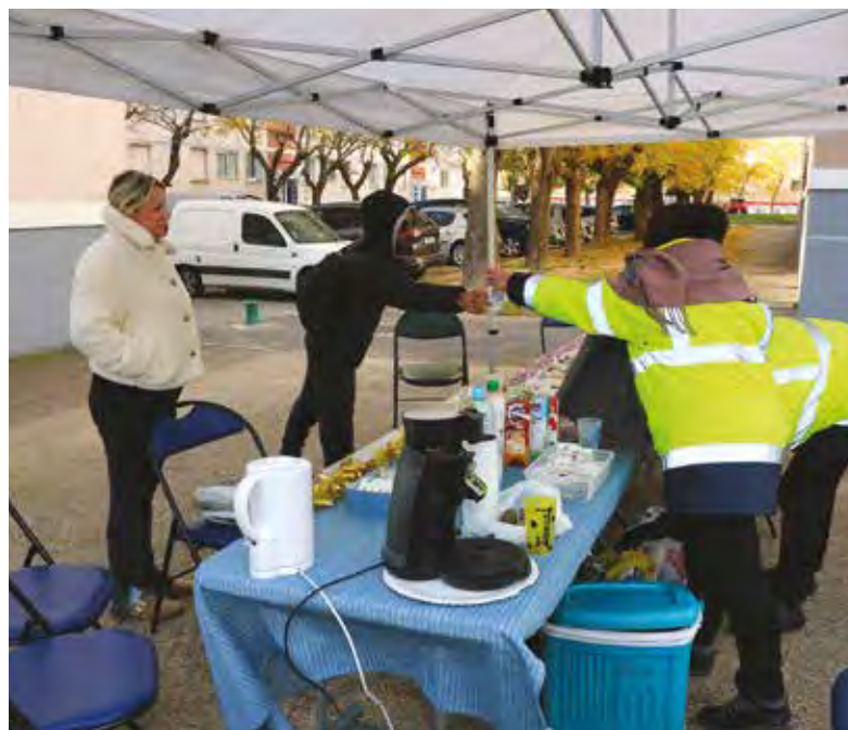
Le café des voisins tous les lundis à Boudème, les mercredis à Canto-Perdrix et les jeudis à Mas de Pouane.

MISS compte actuellement 46 salariés en insertion pour sept encadrants. Un véritable succès,