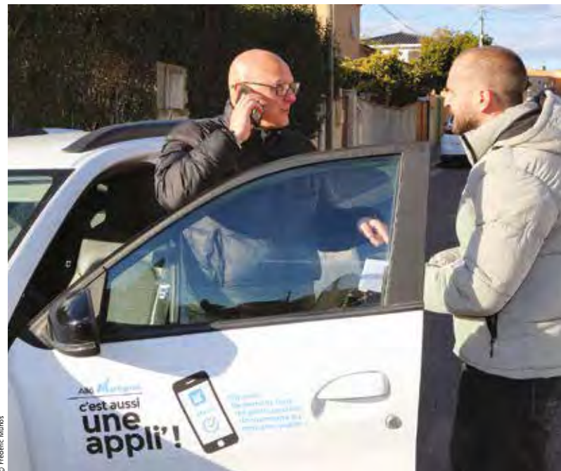
Trou dans la chaussée, lampadaire hors service, mobilier urbain endommagé sont aussi signalés par les deux patrouilleurs qui arpentent la ville tous les après-midi.