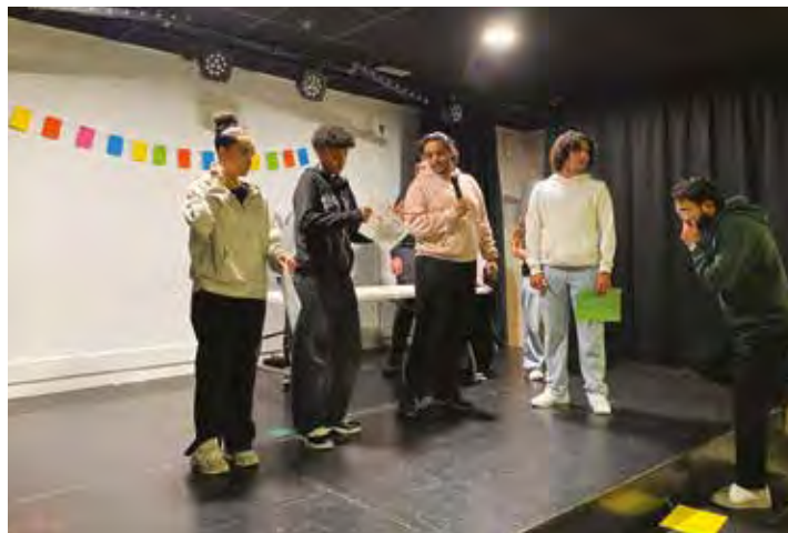
Les Martégaux présentent leur premier travail sur le thème de l'écologie.

Des liens se créent aussi entre les pays lors des voyages. « On garde contact grâce aux réseaux sociaux. Je retrouve même des encadrants qui l'étaient déjà à mon époque. Aujourd'hui, j'encadre avec eux », poursuit l'animateur amusé. À travers ces différentes rencontres, les jeunes Martégaux prouvent que la culture, l'échange et l'ouverture au monde restent des outils puissants pour préparer les citoyens de demain. Sarah Le Guen