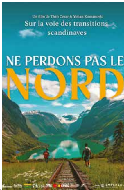
Leur documentaire, qui a été projeté au cinéma La Cascade, participe à de nombreux festivals.