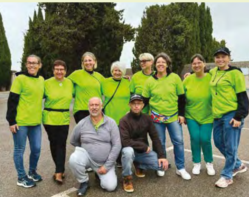
Les « super-bénévoles » du Comité des fêtes, toujours prêts à partager de bons moments.

Les bénévoles du Comité des fêtes n'ont de cesse d'animer le village en proposant chaque mois de nouvelles animations qui font la joie des petits et des grands