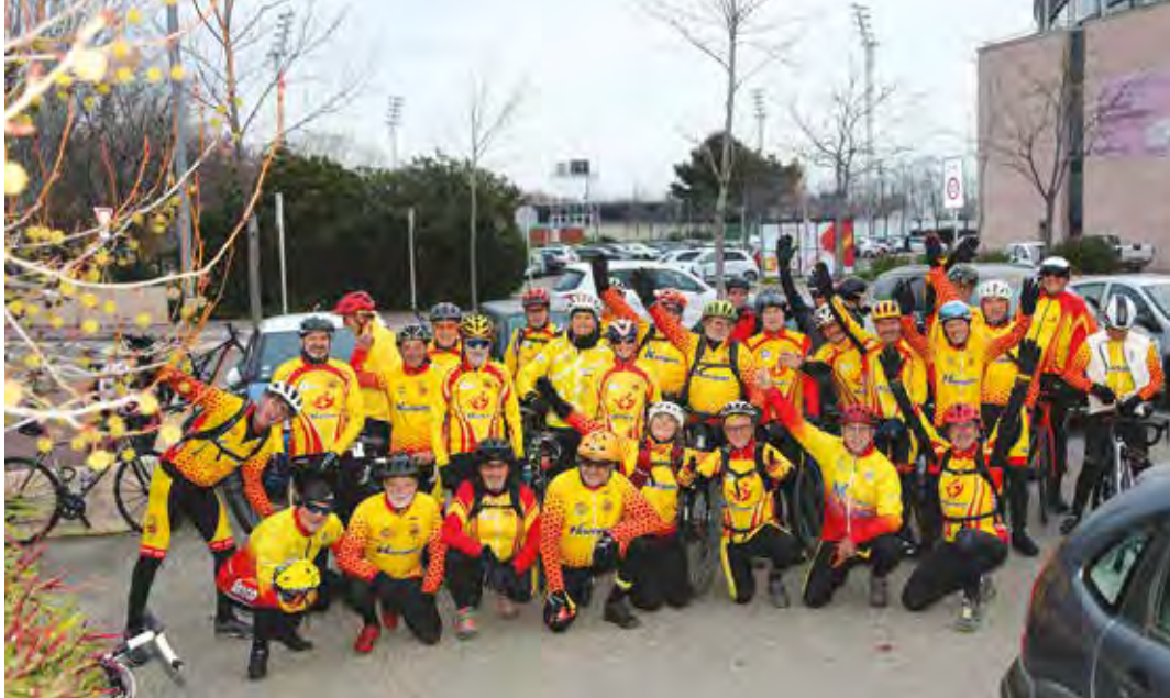
Les cyclotouristes martégaux se retrouvent de bonne heure et de bonne humeur trois matins par semaine pour rouler ensemble.