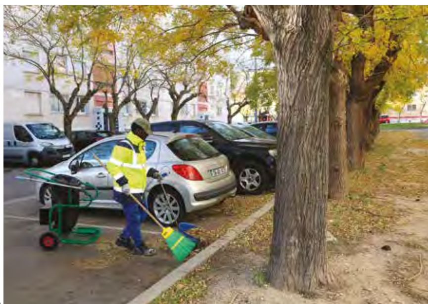
La majorité des salariés en insertion sont aussi des habitants du quartier.