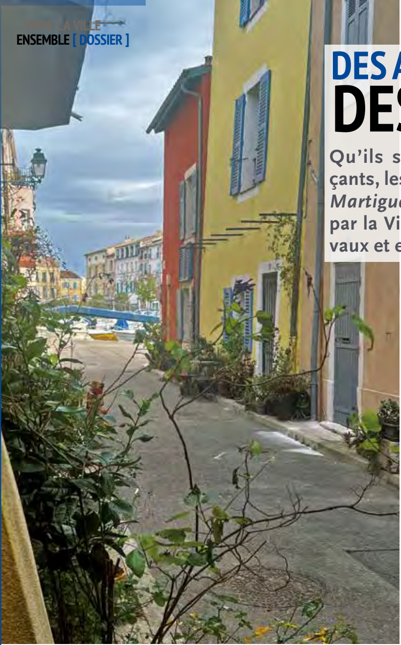
Pourquoi ne pas redécouvrir l'architecture martégale au cours d'une petite balade ?

Qu'ils soient occupants, bailleurs ou commerçants, les propriétaires ayant bénéficié du dispositif Martigues en couleurs trouvent les aides apportées par la Ville très utiles pour mener à bien leurs travaux et embellir leur cadre de vie