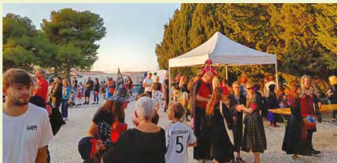
La désormais fameuse « Fête des sorcières » a permis à de nombreuses familles du quartier de se retrouver dans la magie d'Halloween.

Renseignements et adhésion : 07 71 83 11 74 ou comitedesfetes-delacouronne13@gmail.com .