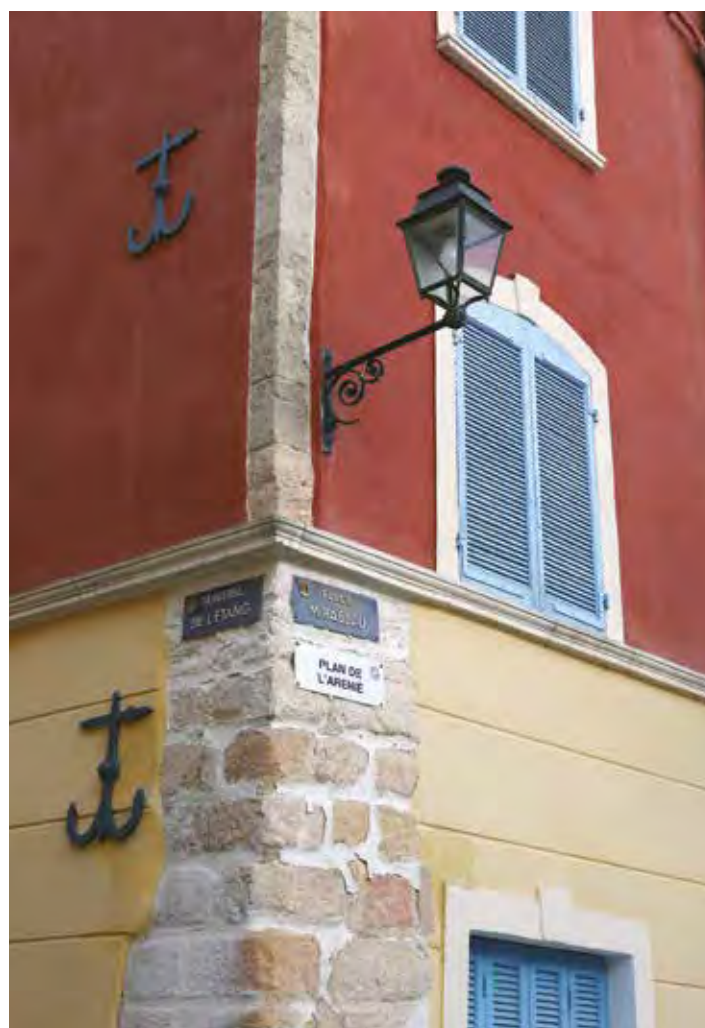
La couleur des façades est soumise à la validation de l'architecte des bâtiments de France.