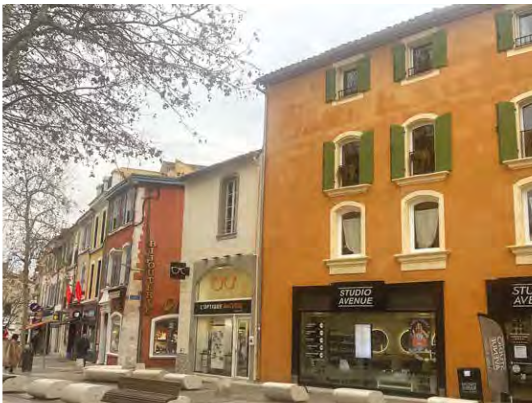
Le dispositif Martigues en couleurs aide les propriétaires à ravalier leur façade comme ici sur le Cours.

Les nouveaux locaux de l'association « Soliha Provence » viennent d'être inaugurés. Ils se situent au 4 boulevard Kennedy. L'association, née il y a 70 ans, intervient sur le territoire martégéal pour aider les personnes à revenus modestes à améliorer leurs conditions d'habitat. Elle œuvre aussi à favoriser l'accès et le maintien dans un logement décent, produire et gérer une offre de logements de qualité à loyer abordable. Enfin, elle contribue à la redynamisation des quartiers et centres anciens dégradés tout en promouvant l'innovation sociale.