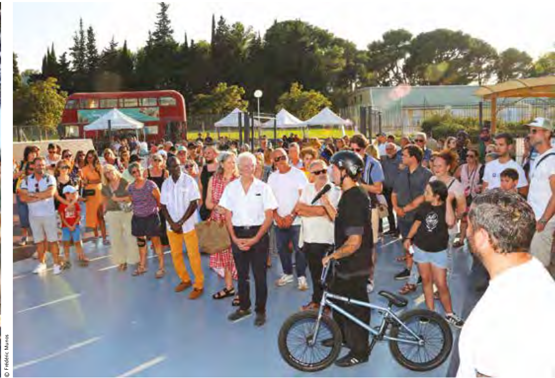
À l'image des projets de Jourde et de la Zone Jeun's, la Ville pense ses équipements pour permettre aux Martégaux, de tous âges, de s'épanouir ensemble.

toujours dans l'intérêt de notre territoire. C'est très différent depuis juin dernier et je ne vois pas comment nous pourrions faire entendre les préoccupations des Martégaux avec des conceptions aussi différentes, que ce soit sur la décarbonation dans l'industrie, l'accompagnement des aidants, ou encore sur l'avenir de l'Hôpital. La période du Covid nous a bien prouvé que les services publics étaient indispensables dans ce pays, et plusieurs fois cet été le service des urgences de l'Hôpital était de nouveau dans le rouge. Clairement, les moyens humains, financiers et logistiques, pour l'hôpital public, sont insuffisants. Il faut de toute urgence que cela change car c'est uniquement grâce à la coopération de l'ensemble du personnel hospitalier, des médecins et des soignants d'autres services non concernés par les urgences, qui ont donné une partie de leur force et de leur temps, que cela peut fonctionner. Vraiment, félicitations à eux ! Mais enfin, ce n'est pas possible de dépendre toujours de la bonne volonté et de la force de travail de gens qui ont déjà leurs propres responsabilités. Il faut un regard nouveau qui redonne de la force et des moyens à l'ensemble de nos services publics et en particulier à l'Hôpital, car si ce sont les mêmes qui gèrent demain le pays, nous n'avancerons pas mieux.