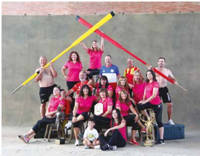
Rameurs, pêcheurs, danseurs, parents et enfants, les Martégaux ont grandement participé au projet photos de Yann Arthus-Bertrand.

Pieds nus, Yann Arthus-Bertrand multiplie les allers-retours sur le parquet chaud de Di Lorto. Le photographe, jamais avare d'une tape dans le dos, parle fort, gesticule et donne des consignes au plus près de ses modèles avant de retourner à son bureau éphémère. Posé sur une table pliante, tout un équipement s'étale. Deux gros appareils photo sont reliés à un ordinateur par un épais câble fluo. Une chaise complète le tableau. Il n'y a pas de trépieds. L'auteur du célèbre « La Terre vue du ciel » prend ses clichés, appareil en main, viseur collé à l'œil. Lorsqu'il est satisfait, son regard se détourne et son index pointe soudain l'écran où s'affichent les prises de vue. « Celle-là ! Celle-là est bien ! », s'illumine-t-il alors. L'énergie et le souci artistique restent entiers malgré les 19 000 portraits déjà réalisés en 30 ans d'avancement de son projet photographique « Les Français