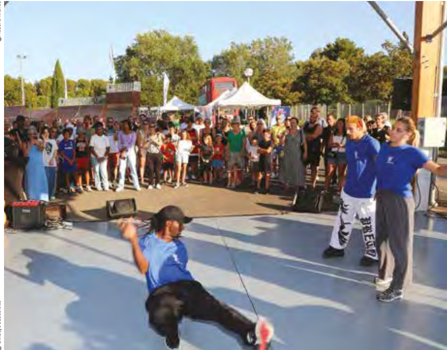
Un mur de graff animé par l'association « Lou Martegue » fait partie des nouveaux aménagements de la zone, tout comme le plateau scénique sur lequel évoluent les breakdancers.