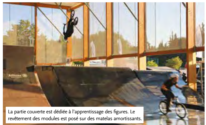
La partie couverte est dédiée à l'apprentissage des figures. Le revêtement des modules est posé sur des matelas amortissants.