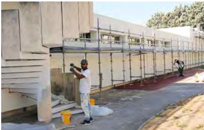
Ici, la photo est prise après les travaux de réfection, réalisés pour protéger les enfants du soleil.

« Petit à petit, on équipe nos écoles de manière à ce qu'il fasse moins froid l'hiver et moins chaud en été, continue Annie Kinas. Maintenant, on se doit de parer au changement climatique. Et puis ça entretient nos bâtiments. En effectuant ces travaux là on répare aussi des petites fissures. »