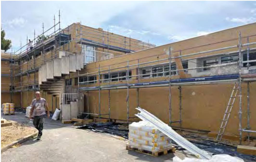
Durant l'été, les façades de l'école maternelle Tranchier ont été refaites. Ici la photo est prise avant les travaux.

Qui dit rentrée scolaire, dit remise à neuf des écoles pour accueillir les élèves. À l'école Tranchier, les changements qui avaient pris du retard l'année dernière ont été entrepris cet été. D'autres petits travaux permettront aux élèves de rentrer dans de bonnes conditions