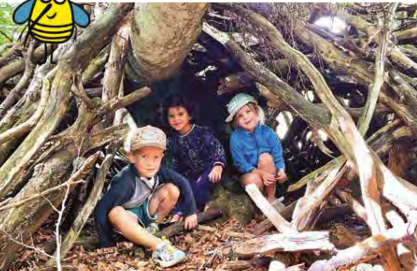
Avec « Les joyeux bombyles », les enfants ont imaginé une cabane sous les branches.

On est tous en contact chaque jour avec les associations. Que ce soit lors de l'entraînement de Krav Maga ou lorsque l'on confie ses chaussures pour les personnaliser à « Save my shoes » à Martigues. Elles nous entourent et rythment nos vies au quotidien.