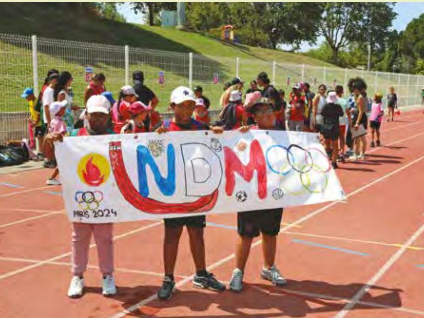
Tous les Centres sociaux et les Maisons de quartier de la ville ont participé.

Les enfants des Maisons de quartier et des Centres sociaux de la ville ont aussi disputé leurs olympiades ; trois jours d'exploits et de sourires partagés !