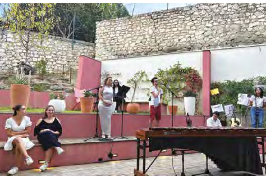
Une grande soirée sur le thème de la paix vous attend à La Cascade le 19 septembre.

Dimanche 22/09 : régata solidaire à la base de voile de Sainte-Anne à 14 h.