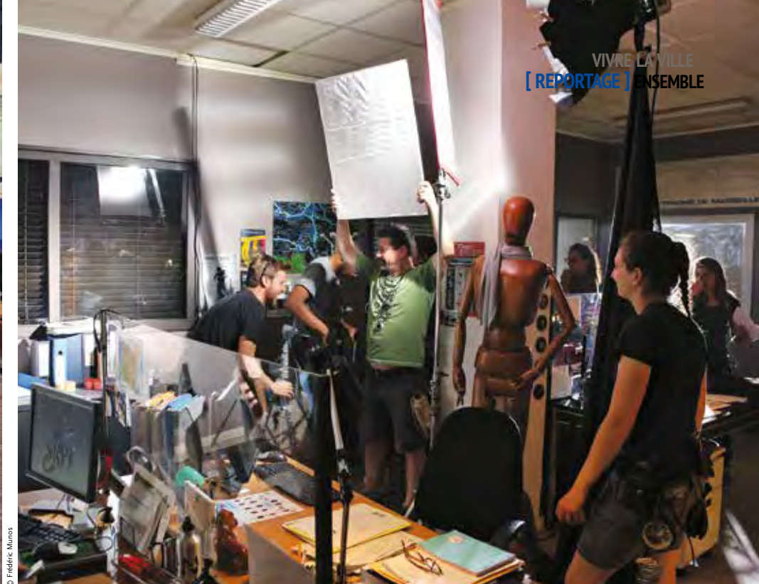
De plus en plus, les productions font appel à de la main d'œuvre locale pour éviter de déplacer des équipes entières sur les lieux de tournage.