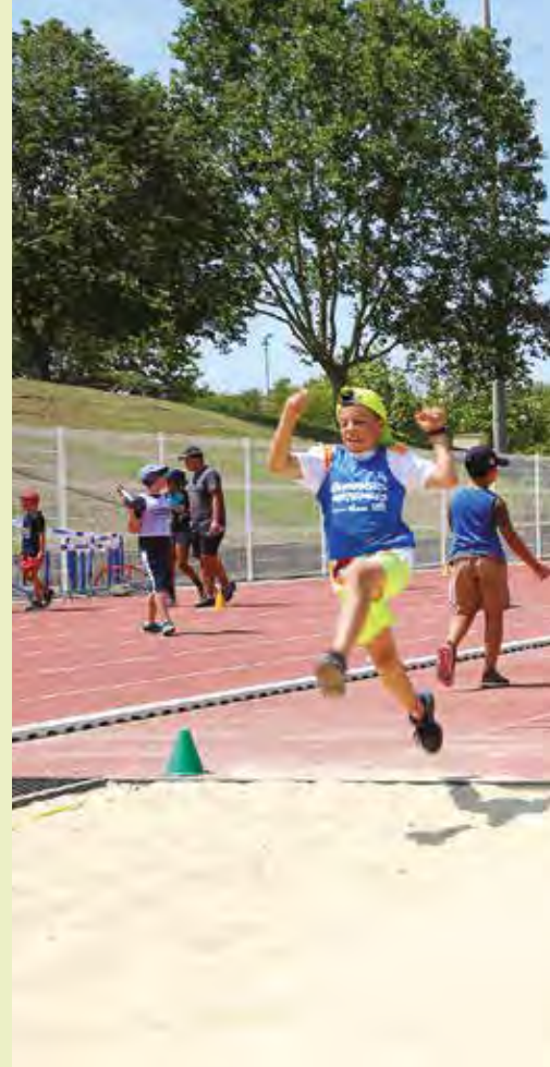
Les petits de Martigues ont fait comme les