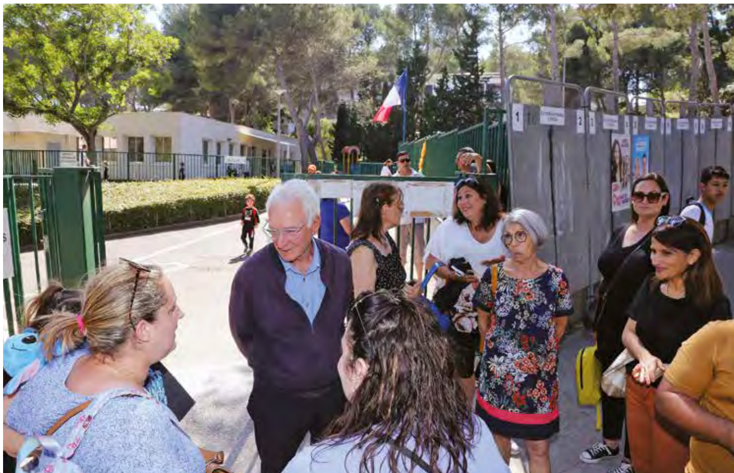
Les parents d'élèves et les enseignants sont soutenus par la municipalité pour l'ouverture de classes à l'école élémentaire Daugey et à la maternelle Canto-Perdrix.

À Martigues, la rentrée scolaire se prépare déjà depuis le mois de juin. Et cette année, à Canto-Perdrix et à Robert Daugey, les parents d'élèves et la Ville réclament l'ouverture de classes. Une décision sera prise ce 2 septembre, à la rentrée