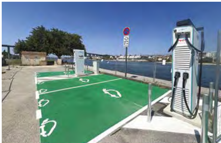
Sept bornes de recharge pour les véhicules électriques sont à la disposition des usagers.

Ils sont de plus en plus nombreux à rouler en électrique dans la Venise provençale et tous satisfaits des bornes déjà installées, comme Lionel, propriétaire de deux véhicules. Cependant, il met en lumière quelques problèmes : « Les bornes sont facturées à la minute, et