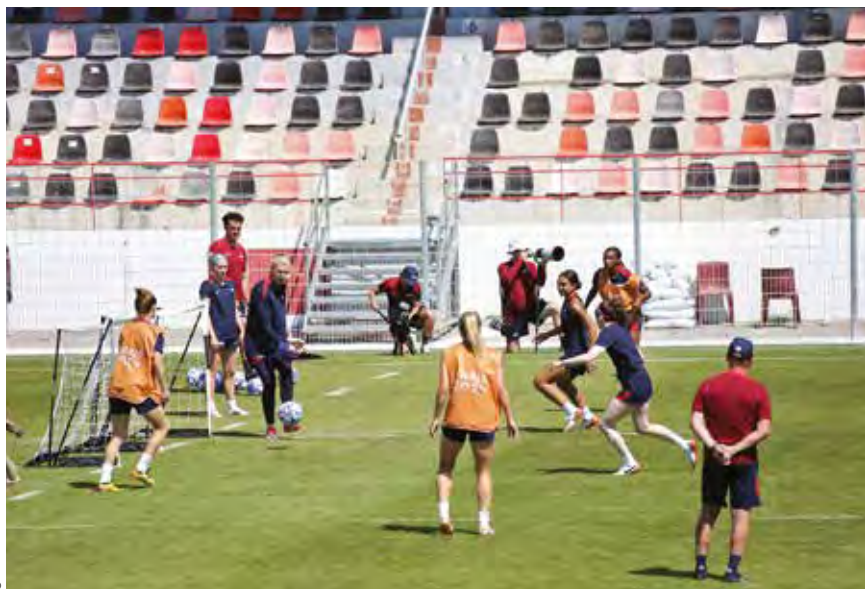
Il y a forcément un peu de Martigues dans la médaille d'or des joueuses américaines.

À voir toute cette décontraction et ce plaisir partagé, on en oublierait presque que c'est la médaille d'or que visaient les « Stars and Stripes » (surnom de l'équipe féminine). Avec quatre coupes du monde à leur actif, quatre titres olympiques sur six possibles depuis 1996, et vingt années passées dans les deux premiers rangs mondiaux, ces Jeux de 2024 pouvaient leur permettre de retrouver de leur superbe, en quittant leur actuelle cinquième place du classement FIFA. « C'est une équipe qui n'est pas venue faire de la figuration, c'est l'élite, et ça se voit rien qu'à leur organisation,