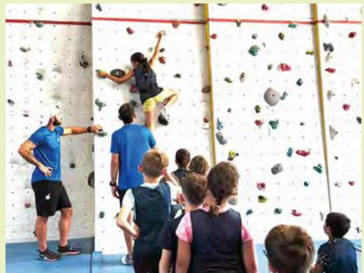
Beaucoup faisaient de l'escalade pour la première fois ; sensations garanties !