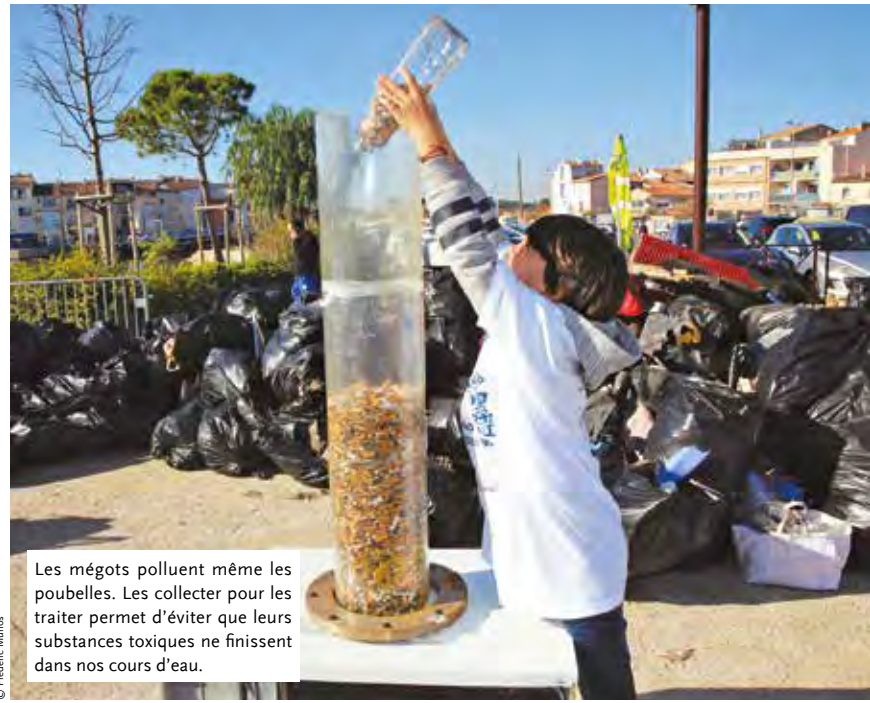
Les mégots polluent même les poubelles. Les collecter pour les traiter permet d'éviter que leurs substances toxiques ne finissent dans nos cours d'eau.

Pour cela, il y aura d'abord une campagne de sensibilisation avec des affiches, vidéos, publications sur les réseaux sociaux ou communication de proximité. Cinquante