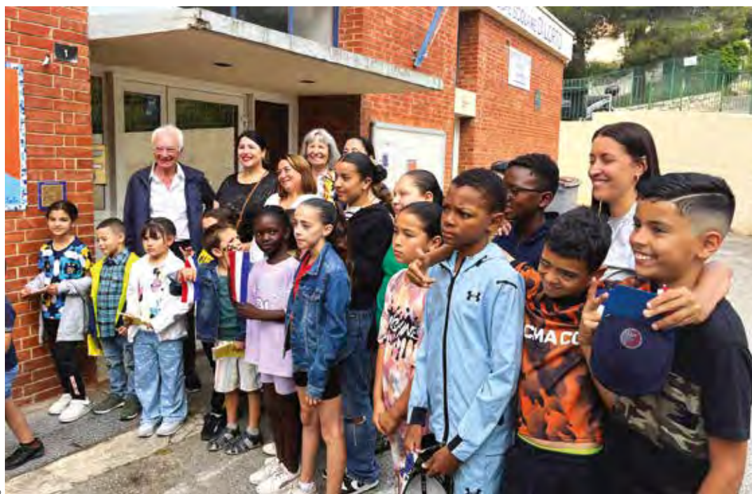
Les élèves de CP et CM2 de l'école Di Lorto ont participé à la création du sentier numérique de leur quartier.

Le parcours qui relie Notre-Dame des Marins à Canto-Perdrix, en passant par la chapelle est désormais parsemé de balises numériques pour en apprendre davantage sur la faune, la flore locale et l'histoire de la ville