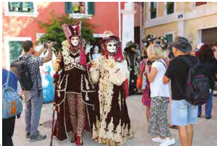
Face au succès, l'association doit limiter à 100 le nombre de masqués vénitiens lors des Flâneries.

déjà réalisé sept costumes. Tous sont soigneusement conservés à l'exception du premier qu'elle a entièrement démonté pour en réutiliser le tissu. Un huitième costume est en préparation, un travail considérable, mais une paille pour les aficionados de longue date. Éliane Damlejian a, par exemple, été contrainte de louer un local entier pour y ranger ses quelque 150 costumes, et ce, pour son plus grand bonheur. Cédric Lombard