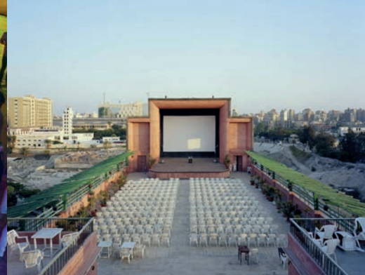
CINEMA RIO ALEXANDRIE, ÉGYPTTE 2010

Organisé par l'AACS en partenariat avec la Ville de Martigues.