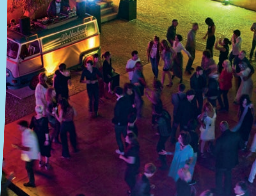
WALKABOUT SOUND SYSTEM

Cet enfant de la balle, fils d'un chanteur et guitariste flamenco qui l'initie à la musique gitane, s'est épris très tôt de la musique de Paco de Lucia. N'oubliant jamais son passé martégali, il partage son univers et ce qu'il a emmagasiné comme énergie et inspiration, dès qu'il le peut avec les habitants de sa ville natale.