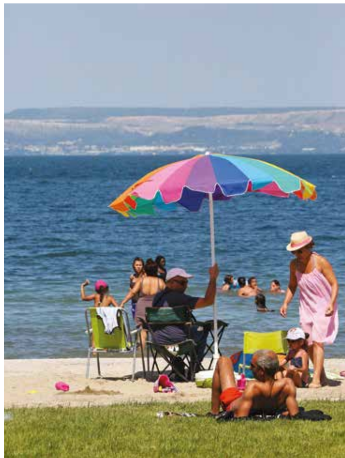
Les Martégaux renouent avec leur plage, un atout de plus pour le renouveau de l'étang.

2018 , c'est durant le 1 er semestre de cette année-là que la gare routière va quitter les abords du Brise-lames pour s'implanter aux Salins.