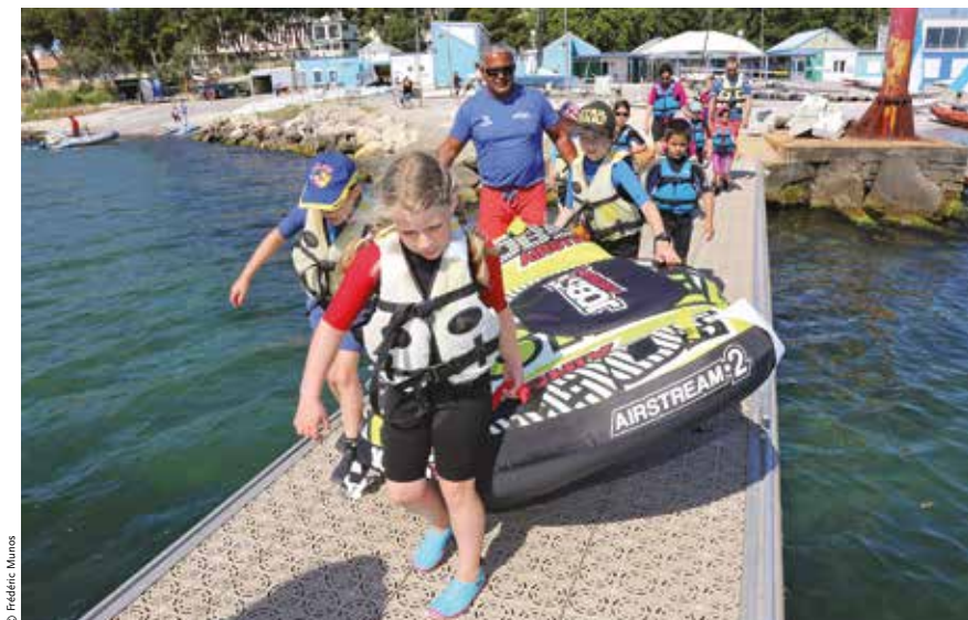
À gauche : les personnes en situation de handicaps peuvent bénéficier d'un matériel adapté. À droite : le samedi matin, les « moussaillons » s'emparent des lieux.