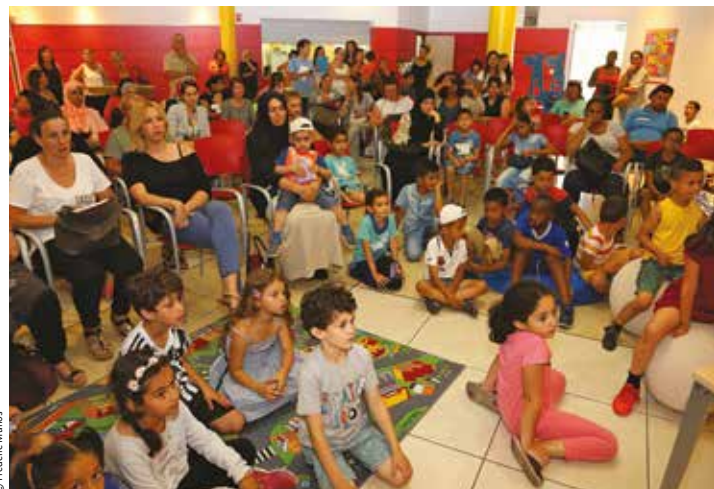
La salle de la médiathèque était comble pour ce qui était un peu une fête de fin d'année.

Les petits Martégaux des clubs Coup de pouce se sont retrouvés à la médiathèque à l'occasion du Prix des premières lectures de l'association. Ils ont lu les quatre ouvrages sélectionnés au niveau national et rencontré deux auteurs venus spécialement dédicacer leur livre, offert à chaque enfant par la médiathèque.