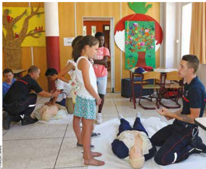
Les enfants sont initiés aux premiers secours directement avec les pompiers.