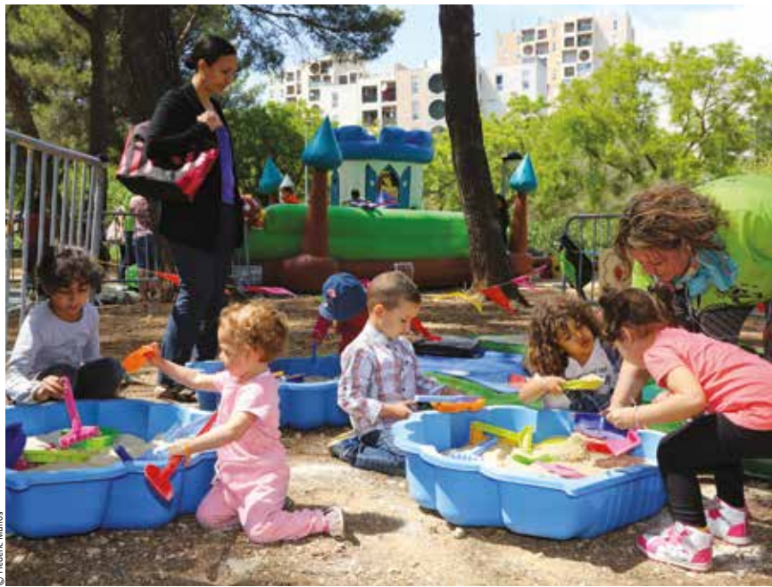
Le 8 juillet, le quartier de Saint-Roch fera sa journée « plage ». Un moment très attendu !

Du côté de Canto-Perdrix à la Maison Pistoun, on prend le large avec des sorties qui mèneront les adhérents à la Bambouseraie le 6 juillet, à la Fontaine de Vaucluse, le 13 et à Aqualand le 2 août. La Maison NDM, propose un séjour à la montagne pour les adolescents de 13 à 15 ans. Mais aussi des sorties paddle, de la bouée tractée, et des