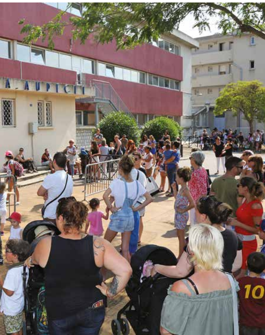
normes d'accessibilité des personnes en situation de handicap.