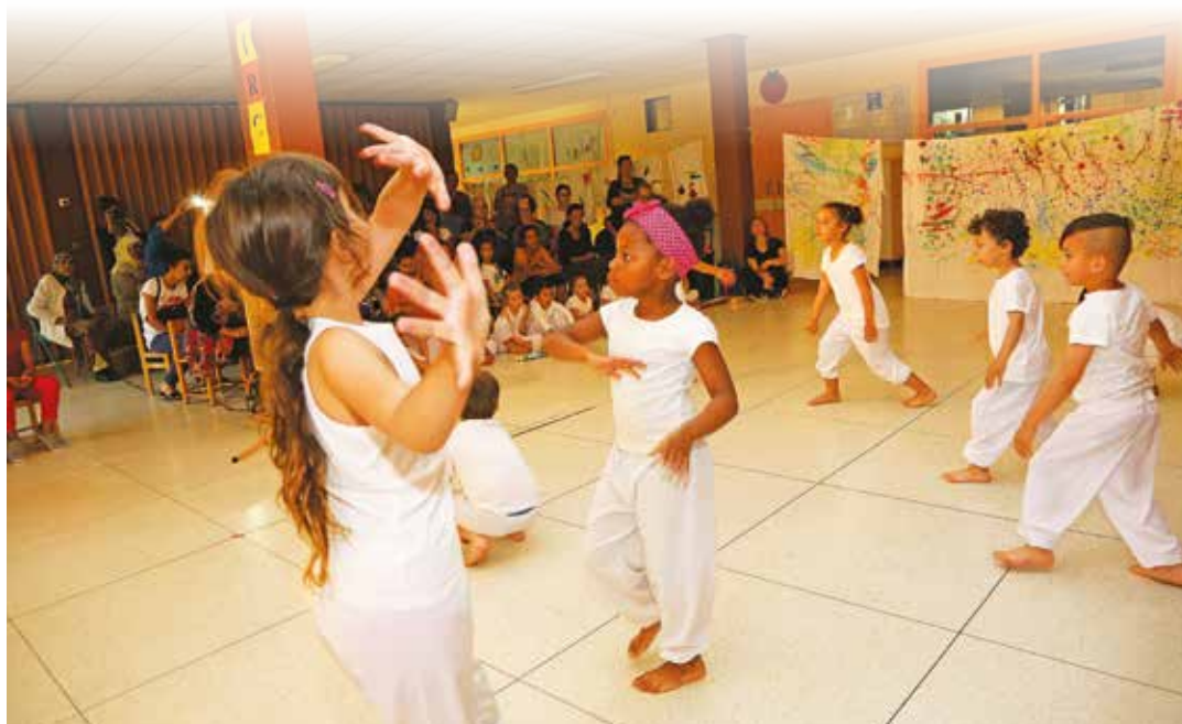
Après les ateliers des Maisons de quartier, les enfants peuvent poursuivre leur apprentissage au conservatoire de musique et danse Pablo Picasso.