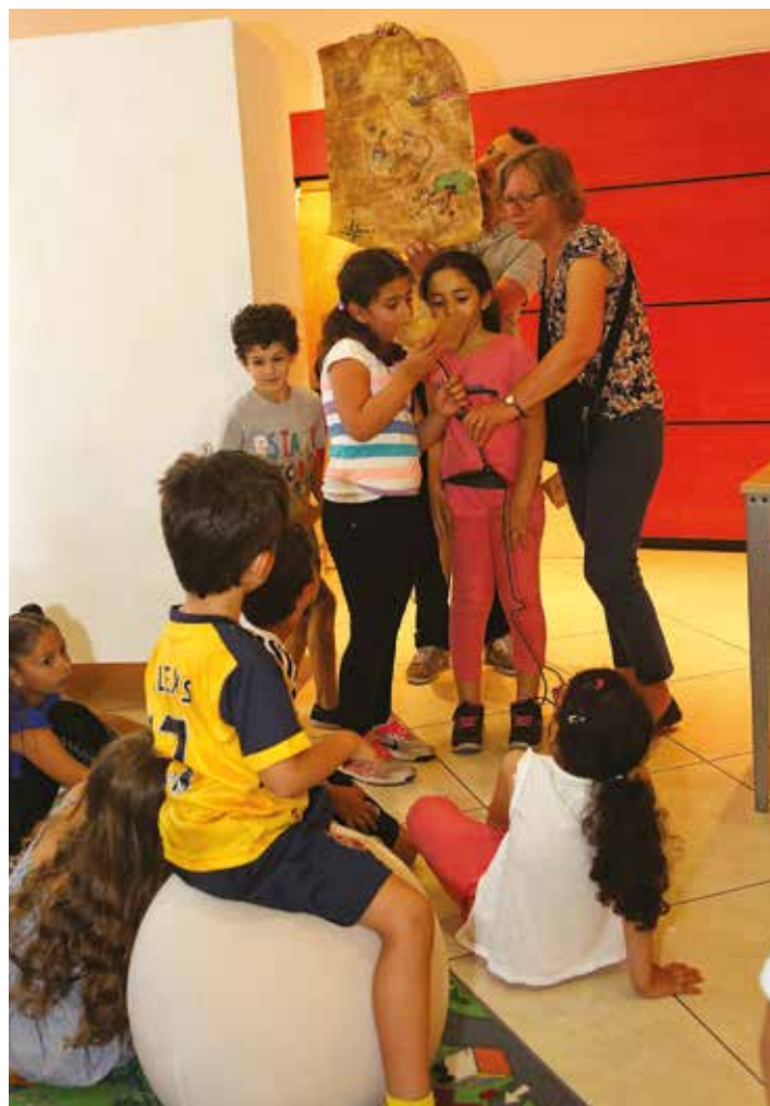
Les enfants ont présenté, aux auteurs des livres étudiés, le travail qu'ils leur avaient inspiré.