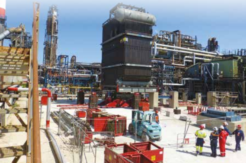
Ici, l'installation d'une des deux chaudières qui devraient démarrer en fin d'année.

Plusieurs centaines de millions d'euros d'investissement sont prévus sur le site de Lavéra