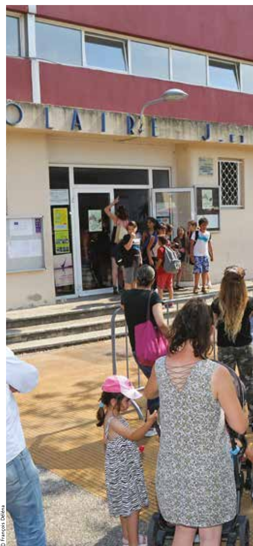
Cet été, la primaire Aupècle sera entièrement mise aux