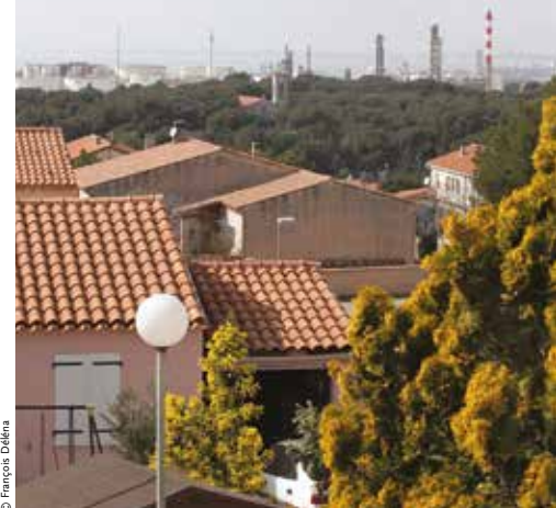
Le PPRT de Lavéra prend du retard.

1 000 personnes travaillent sur la plateforme pétrochimique de Lavéra.