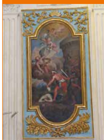
TABLEAU À DÉCOUVRIR