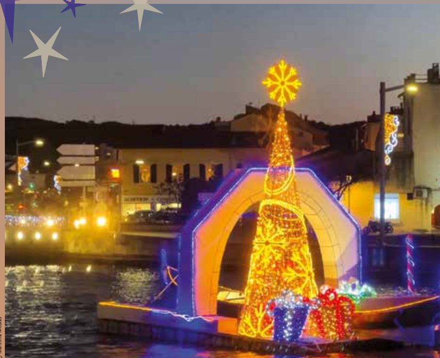
Le public pourra aussi faire le tour des rues et ruelles de la ville à la recherche des plus belles illuminations. Ici, entre les ponts bleus, elles sont souvent parmi les plus jolies