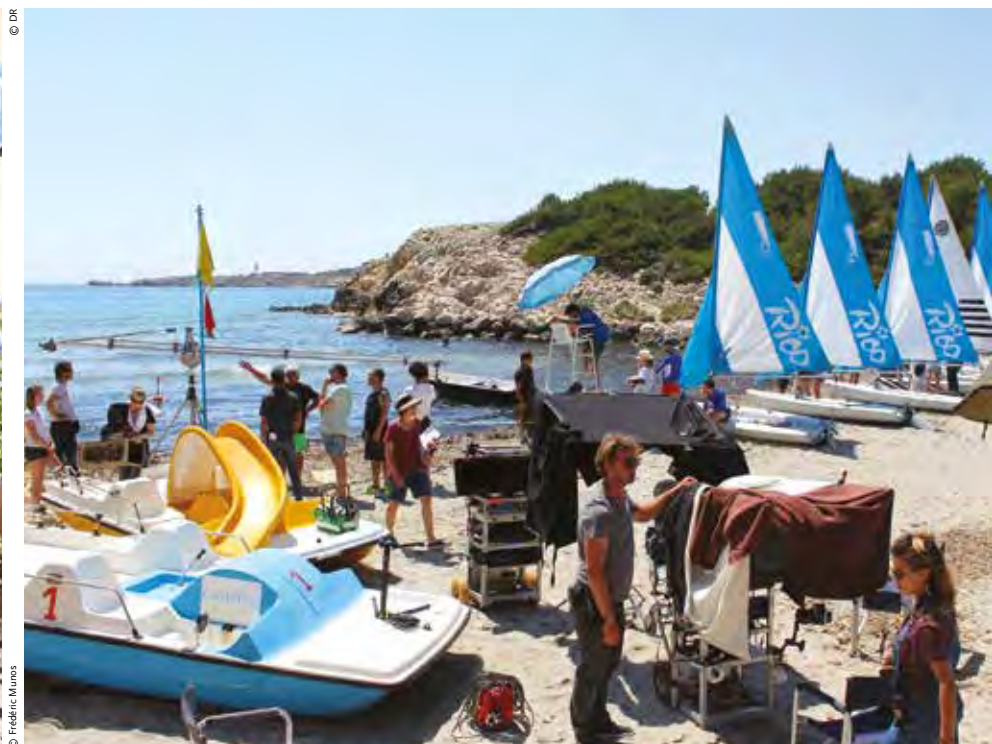
à l'instar de « Léo Mattéi » ou « Pax Massilia » ; mais la star reste la plage de Sainte-Croix. La série à succès « Camping Paradis » y installe ses caméras depuis seize saisons.