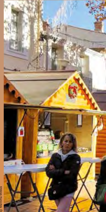
Des animations auront lieu dans tous les quartiers de la ville. Dans L'Île les automates sont présents dans les vitrines, et les artisans s'exposent dans les chalets du marché de Noël de Jonquières