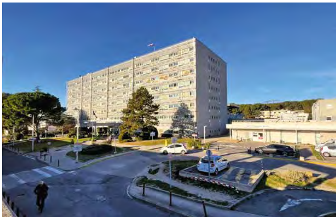
L'hôpital de Martigues attend, ce mois-ci, la validation de l'ARS pour son programme détaillé de rénovation.

Malgré le rapport préoccupant de la Chambre Régionale des Comptes sur sa situation financière délicate, l'hôpital de Martigues reste plein d'espoir pour son avenir