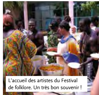
L'accueil des artistes du Festival de folklore. Un très bon souvenir !

« Les habitants se sont très vite emparés de cette maison et ont répondu présent.