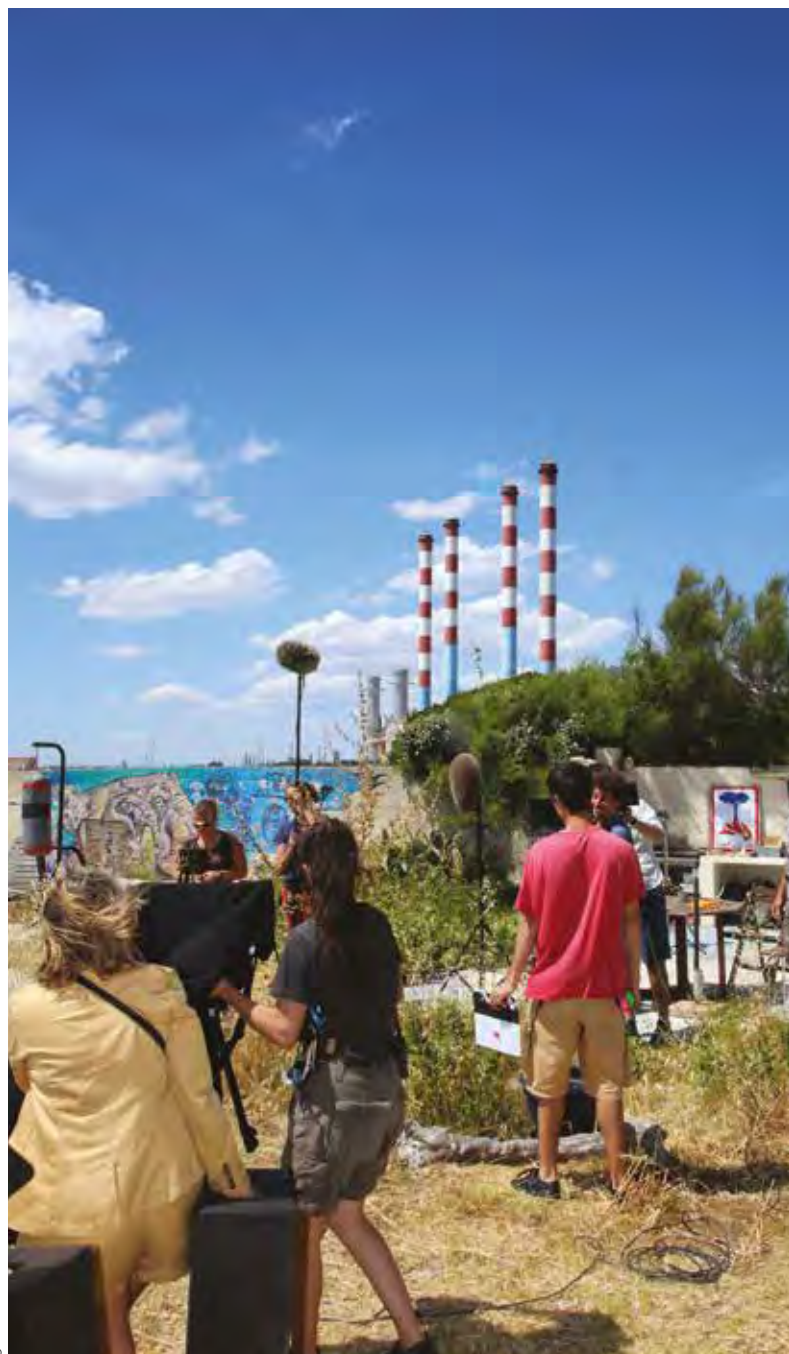
La calanque de Ponteau fait partie des décors fortement plébiscités par les productions.

Troisième épisode de notre feuilleton consacré aux liens entre Martigues et le cinéma. Ce mois-ci, Reflets s'intéresse à l'attractivité de la ville à travers ses nombreux lieux de tournage. Au moins quatre raisons peuvent expliquer un tel succès