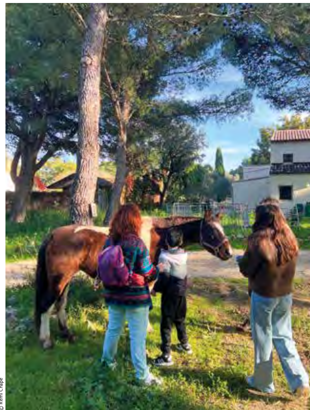
Toucher la laine des moutons ou brosser un cheval leur permet d'apprendre à interagir avec leur entourage et de prendre confiance en eux.

ne faut pas, le garçon teste alors d'autres interdits, et tente de lancer des cailloux.