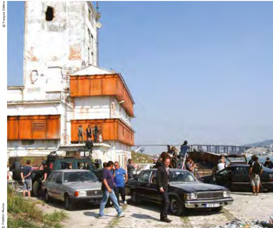
Que ce soit avec ses paysages naturels ou patrimoniaux, Martigues offre une grande diversité de décors extérieurs. L'ancien silo Vermink apparaît dans de nombreux films ou séries