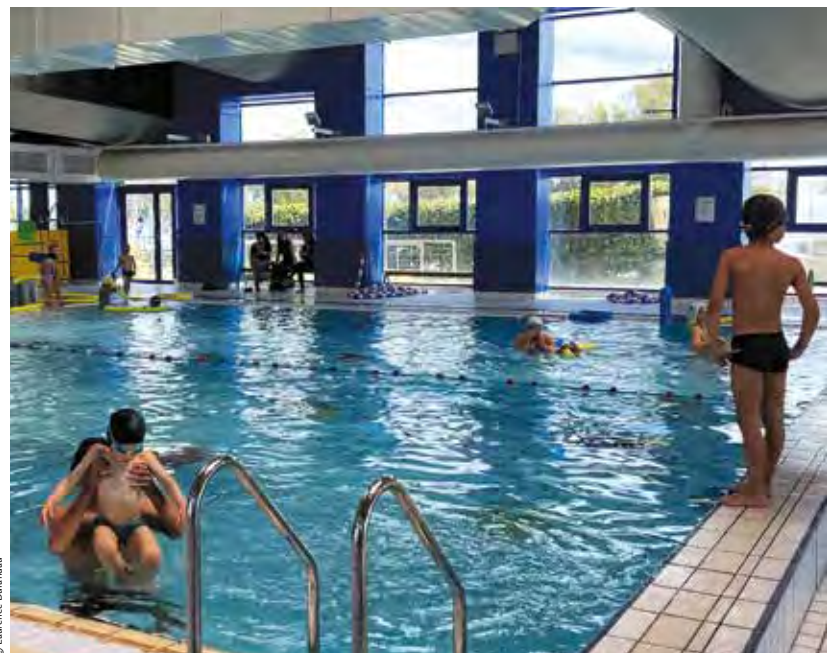
La piscine Avatica répond d'abord à la volonté nationale d'apprendre à nager à tous les enfants. Mais la structure permet aussi à de nombreuses associations de pratiquer leurs activités.