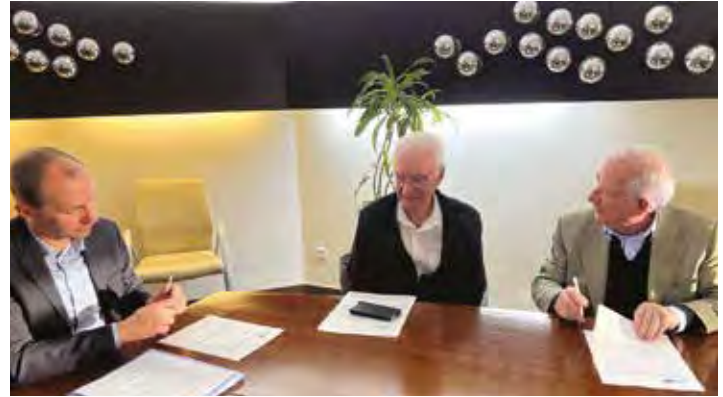
Maintenant que l'achat est finalisé, le nouveau mammographe va être installé.

« L'évolution des technologies est un sujet important, conclut le directeur. Surtout pour un établissement comme le nôtre. Il faut savoir que l'achat de chaque machine se fait en concertation avec les médecins et qu'ensuite une formation leur est proposée. » La prise en charge de ce nouveau mammographe devrait être simple, en revanche, sa taille peut être surprenante pour les patientes ; pas plus grosse qu'un petit écran télé. G.S.