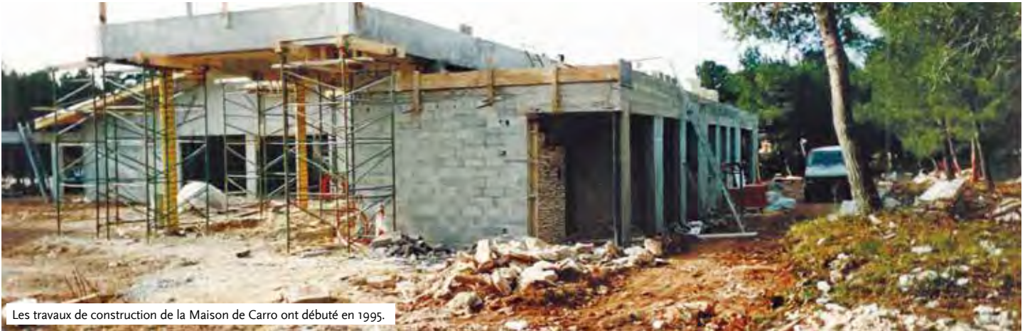
Les travaux de construction de la Maison de Carro ont débuté en 1995.