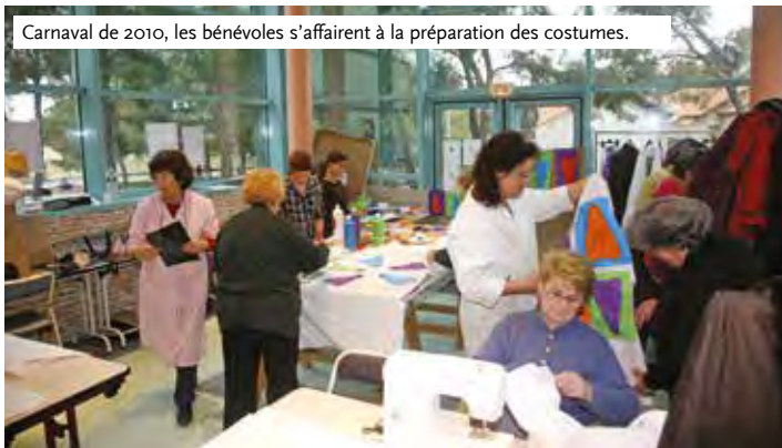
Carnaval de 2010, les bénévoles s'affairent à la préparation des costumes.

C'est le nom que les habitants du conseil de Maison ont choisi pour rebaptiser la Maison de quartier. Cela s'inscrit dans le cadre de la féminisation des noms de lieux et de bâtiments portée par la municipalité. En écho au passé du quartier, Anita Conti fut la première femme océanographe. C'est elle qui a dressé les premières cartes de pêche et s'est inquiétée des effets de la pêche industrielle sur les ressources halieutiques. L'inauguration du nouveau nom sera célébrée le 16 décembre.