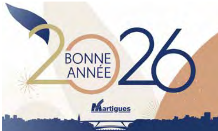
Le public est attendu le vendredi 9 janvier pour la cérémonie des vœux 2026.

l'emploi, les retraites, le service public, pour ne citer que ceux-là.