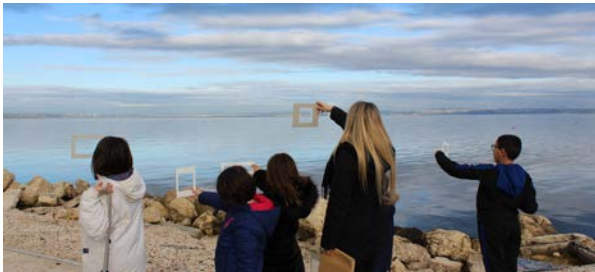
Ci-dessus : Atelier « Le petit monde de Martigues ».

Son objectif est de mettre à disposition pour chacun et chacune, petit.e.s et grand.e.s, la grande diversité des ressources de notre territoire tout en répondant aux engagements de la Ville et à l'exigence du label Ville d'art et d'histoire attribué en 2012 par le Ministère de la Culture et de la Communication.